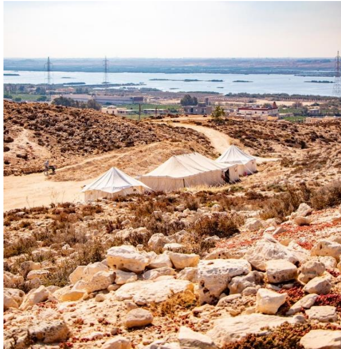
Vue de la fouille de Plinthine. En arrière plan, le lac Maréotis.

▶▶ La charte éthique du fonds de dotation « Archéologie & Patrimoine en Méditerranée » ( Arpamed ) est un véritable engagement moral du fonds auprès de ses mécènes et partenaires institutionnels. La présente Charte établit les principes éthiques d'Arpamed qui cadrent son action.