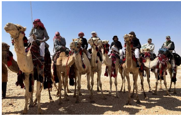
Premier jour de la caravane