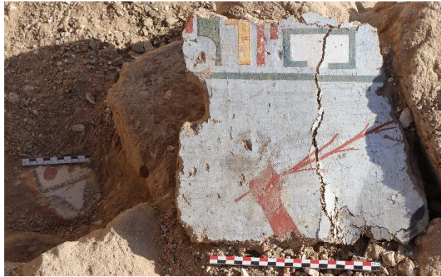
Deux fragments d'enduit peint, in situ dans la hague 1082