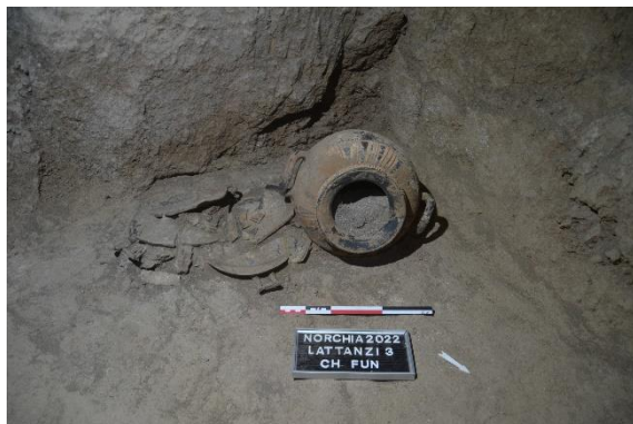
Stamnos in situ © Vincent Jolivet.