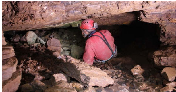
Thorikos, exploration de la Mine n°6