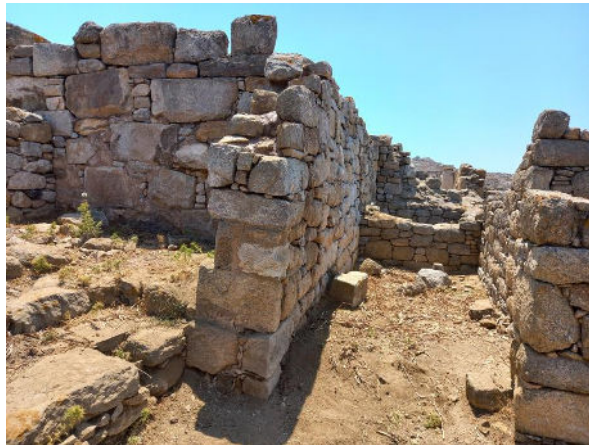
L'extrémité nord du mur 16 après stabilisation © EFA.

Montant du financement : 12 000 €. Le versement a été réalisé en 2023.