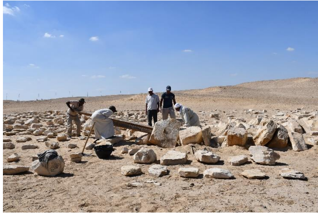
Le dégagement des blocs © A. Ciavatti.