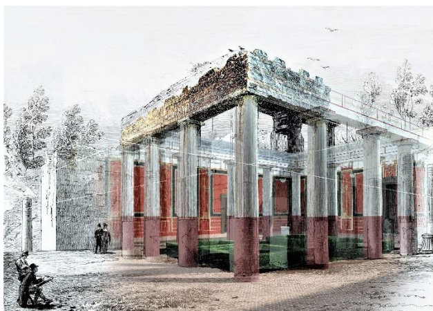
Pompéi, Villa de Diomède, péristyle d'entrée. Insertion d'une vue du "Grand Tour" des années 1820 (W.B. Cooke, Pompeii, illustrated with picturesque views, Londres, 1827, vol. 2, pl. 46) dans la modélisation de 2019. Réalisation Alban-Brice Pimpaud (archo3d) © Villa Diomedes Project.