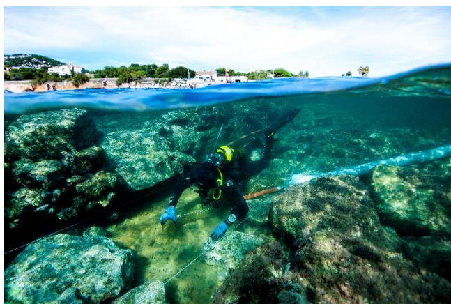
Plongeur en action