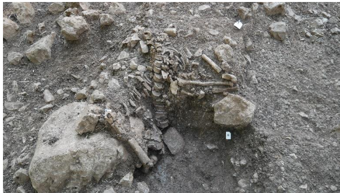
Sépulture en position assise © Mission Eynan-Mallaha 2022.