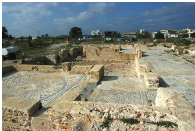
Thapsus (Tunisie) – Ensemble monumental © Mission Thapsus 2019.