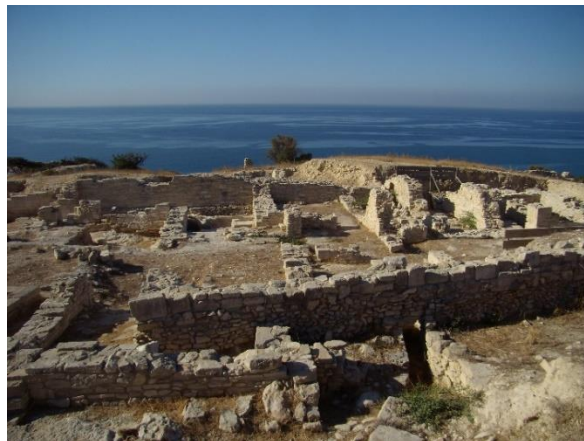
Amathonte : aile ouest des entrepôts du palais © Antigone Marangou.