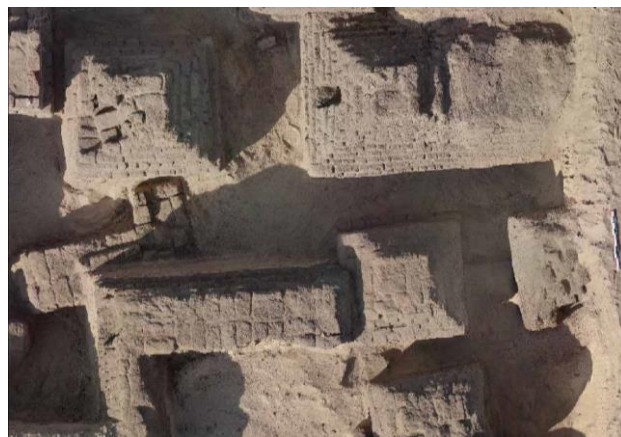
Tombes vues du dessus