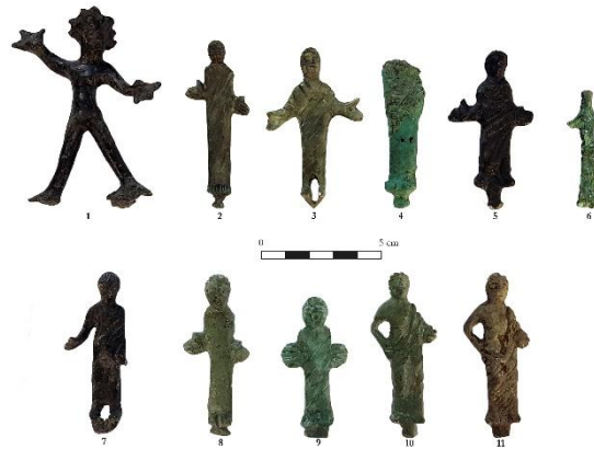
Série de petits bronzes votifs (IVe-IIe s. av. n. è.) représentant des personnages en prière © Martin Jaillet.