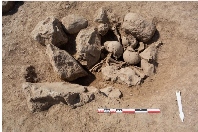
Sépulture secondaire L266 © Mission Kirrha.