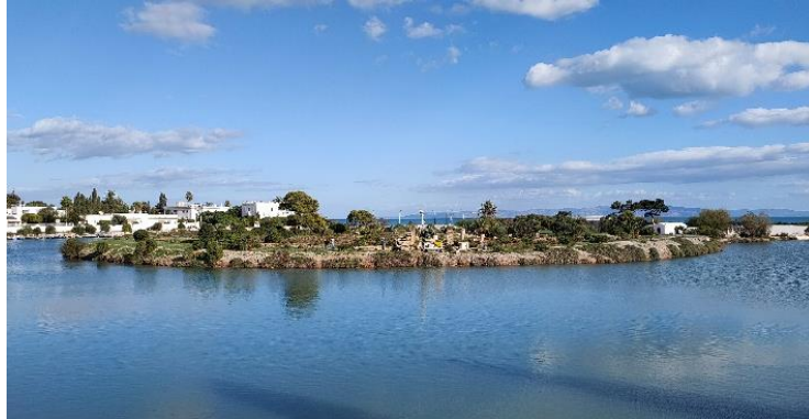
Mission scientifique de Carthage 2022